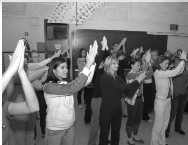
Razvijanje plesnosti je temelj vsega dela v folklornih skupinah. (začetni seminar za vodje otroških/odraslih folklornih skupin, Ljubljana, oktober 2006 - april 2007.)

Otroške folklorne skupine so v prvih letih razvoja povsem posnemale odrasle, danes pa oblikujejo svoj program, ki se od programa odraslih bistveno razlikuje. Otroci so nekdanj tudi plesali, in sicer so plesali svoje otroške plese (ki jih ni veliko) in so vsaj občasno plesali ob odraslih. Naša naloga je, da skladno z razumevanjem vzgojno izobraževalnih nalog približamo otrokom poenostavljene različice odraslih plesov ter da predstavljamo dogodke iz življenja otrok v preteklosti. Naša glavna naloga pa je, da seznanimo svoje plesalce in godce z ljudskim izročilom, a ga pri tem ne maličimo in neprimerno interpretiramo, temveč ustvarimo tako podobo preteklosti, ki jo bo današnji otrok in obiskovalec naših prireditev lahko sprejel in doumel. Bodimo ponosni na ljudsko umetnost, ki ne služi samo širšemu kulturnemu namenu, saj motivi iz preteklosti lahko v vsakem posamezniku ponujajo številne možnosti za duhovno izražanje v sodobnosti.