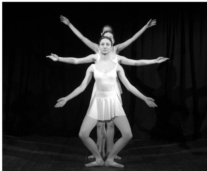
Fotografija iz knjige s pripisom: Simetričnost v telesu.