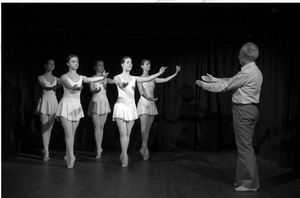
Fotografija iz knjige s pripisom: Koreograf pri delu s plesalci.

Čeprav bo folkornika sprva morda motil jezik, ki se kljub strokovnosti, kateremu se pisec ne more izogniti, trudi biti razumljiv in jasen, bodo bralca pritegnili tudi zanimivi in raznovrstni citati, ki podajajo osebne izkušnje avtorja ali katerega drugega koreografa na obravnavano temo in tako poživijo vsebino in jo naredijo privlačnejšo. Navkljub vsemu bo "koreograf ljudskega plesa v folklorni skupini" našel ob prebiranju te knjige številne uporabne napotke, ki jih bo lahko s pridom prenesel v svoje delovno okolje. Nenazadnje tudi zato, ker iz nje veje neizmerna ljubezen do plesa kot umetnosti.