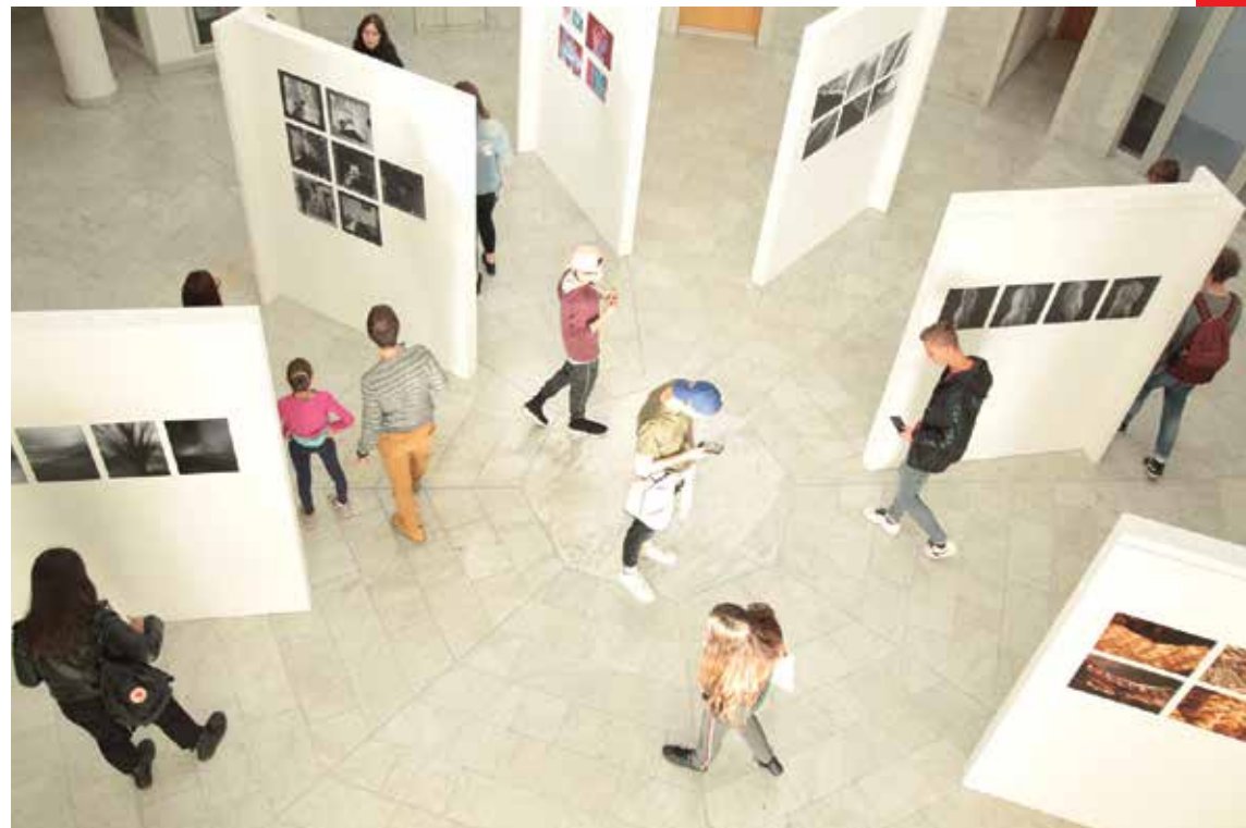
Postavitev razstave Fotovizije v SNG Nova Gorica 2019