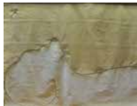
Valentina Ljubotina: BREZ NASLOVA, mešana tehnika, 100 x 70 cm, 2017