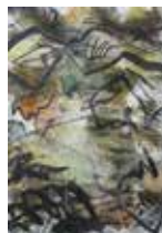
Peter Gaber: VTIS DIVJINE, akril in različna risala na platnu, 100 x 70 cm, 2107