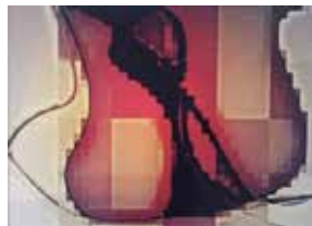
Marija Prelec: IZKOPANINA, računalniška grafika, 100 x 72 cm, 2017