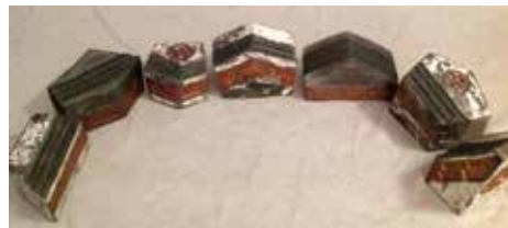
Maja Fonda Cirman: DVE POTI IN KOLO, keramika – raku, 80 x 15 x 15 cm, 2017