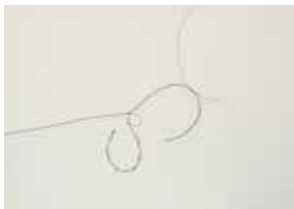
Alenka Čož: ČAS / STRINGS OF LIFE, strune na platnu, 100 x 70 cm, 2017