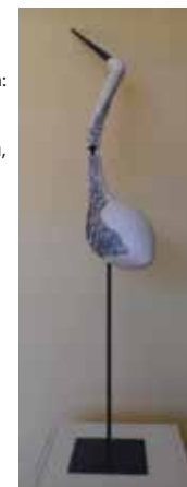
Darinka Lapajne: ŽERJAV, bela šamotirana glina in porcelan, 121 x 65 x 20 cm, 2017