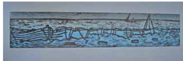
Borut Ovsenek: ČOLNI, barvni lesorez, 100 x 35 cm, 2017