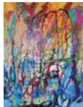
Anatolija Štrlekar: EKSPLOZIJA BARV IN ČRT, akril, 90 x 70 cm, 2017