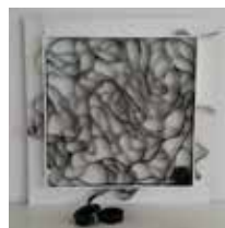
Mojca Perše: RAST, relief (abstraktna instalacija - preplet filmskega traku), 100 x 100 x 3 cm, 2017