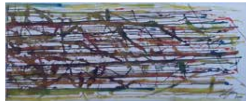
Janez Ovsec: ROJSTVO ČRTE, akvarel, 100 x 60 cm, 2017