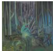
Vladimira Klun Žerjav: GLAS PIŠČALI, mešana tehnika, 100 x 100 cm, 2017