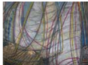
Edita Marija Černelč: REGATA, mešana tehnika, 100 x 70 cm, 2017