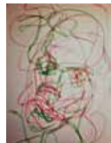
Srna Mandič: LEV NIKOLAJEVIČ MIŠKIN, risba, 100 x 70 cm, 2017