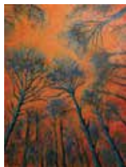
Andreja Završek: V GOZDU, akril, 100 x 70 cm, 2017