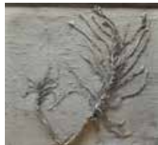
Štefka Zajec: BREZ NASLOVA, mešana tehnika, 100 x 90 cm, 2017