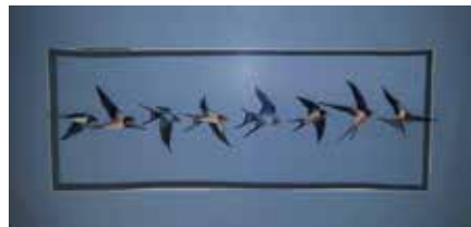
Henrik Krnc: NASVIDENJE SPOMLADI, suhi pastel, 100 x 50 cm, 2017