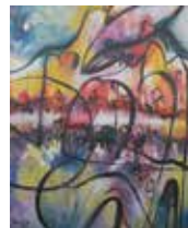
Ljuba Mikolič: MALI POLJEDELEC, akril na platnu, 100 x 70 cm, 2017