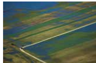
Andreja Peklaj: JEZERSKE VIJUGE, fotografija, 100 x 70 cm, 2017