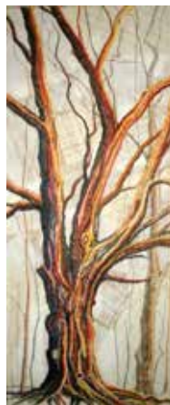
Ida Knez: DREVO, mešana tehnika, 102 x 42 x 3 cm, 2017