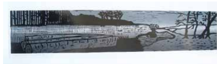
Nataša Kovše: OB GOZDU, barvni lesorez, 100 x 34 cm, 2107