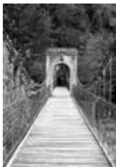
Jože Loc: DO KONCA IN NAPREJ, fotografija, 100 x 70 cm, 2017